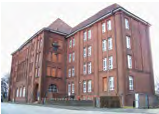
Das Schulgebäude Bullenhuser Damm 92/94, 2012. ANg

Die Morde an den Kindern und ihren Betreuern dienten dazu, die Zeugen der medizinischen Menschenversuche im KZ Neuengamme zu beseitigen. Die meisten der beteiligten Täter konnten 1946 dennoch vor ein britisches Militärgericht in Hamburg gestellt und verurteilt werden. Die Namen der Kinder dagegen waren nach Kriegsende in Deutschland zunächst nicht bekannt. Erst die jahrzehntelange Spurensuche, an der ehemalige Häftlinge des KZ Neuengamme, Justiz, Medien, Angehörige der Opfer und Historiker beteiligt waren, förderte Einzelheiten zu den medizinischen Experimenten und den Opfern zutage. Ungeklärt blieben bis heute die Identitäten der in derselben Nacht am selben Ort ermordeten sowjetischen Häftlinge und die Gründe für diese Morde. Für die 2011 fertiggestellte Dauerausstellung und dieses Buch konnte auf frühere Rechercheergebnisse und bereits vorhandene Darstellungen zurückgegriffen werden. Diese wurden ausgewertet und zum Teil neu interpretiert. Eine überaus wichtige Grundlage war dabei die Sammlung des 2008 verstorbenen Journalisten Günther Schwarberg, die im Archiv der KZ-Gedenkstätte Neuengamme verwahrt wird. Schwarberg hatte seit Ende der 1970er-Jahre umfangreiche biografische Recherchen über die Opfer angestellt, die er 1979 in der Zeitschrift »Stern« als Artikelserie »Der SS-Arzt und die Kinder« sowie in einem gleichnamigen Buch publizierte, womit er das Verbrechen erstmals einer größeren Öffentlichkeit bekannt machte. Neben diesem reichhal-